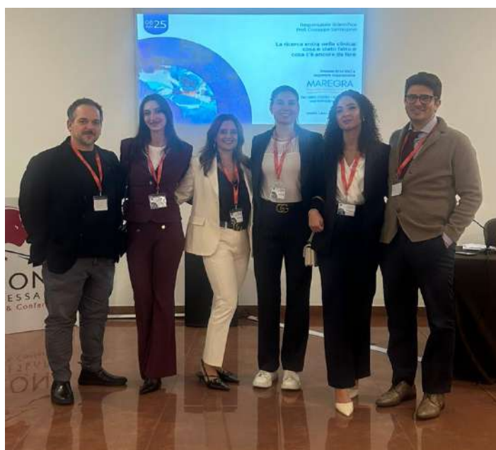
Parte del gruppo di ricerca durante il convegno scientifico dedicato alle attività di ricerca clinica in cardiocirurgia.

Le prospettive future includono l'ampliamento delle attività di ricerca in contesti multicentrici, il consolidamento del percorso di pre-abilitazione e il miglioramento delle strategie di gestione della terapia anticoagulante. Si inserisce, in aggiunta, uno studio in fase di avvio dedicato all'esplorazione della possibile correlazione tra terapia con warfarin e infertilità maschile, che rappresenta un'evoluzione coerente delle linee di ricerca già attive sulla gestione della terapia anticoagulante e mira ad approfondire un ambito finora esplorato solo in fase pre-clinica.