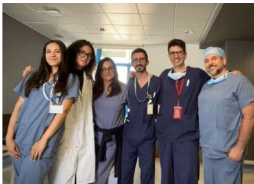
Parte del gruppo di ricerca coordinato dal Prof. Santarpino coinvolto nei diversi progetti in cardiocirurgia.

A partire da giugno 2025, il gruppo di ricerca coordinato dal Prof. Giuseppe Santarpino ha concentrato la propria attività su diversi ambiti della gestione del paziente cardiocirurgico, con l'obiettivo comune di ottimizzare il percorso perioperatorio, valutare gli outcome clinici e contribuire allo sviluppo di strategie terapeutiche sempre più personalizzate. L'attività svolta si è articolata in più filoni di ricerca, tra loro complementari, che hanno affrontato differenti aspetti del percorso cardiocirurgico, dalla fase preoperatoria alla gestione a medio-lungo termine.